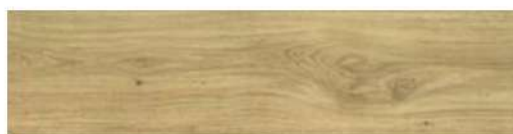
DĄB DENVER NATURA PANEL PODŁOGOWY LAMINOWANY