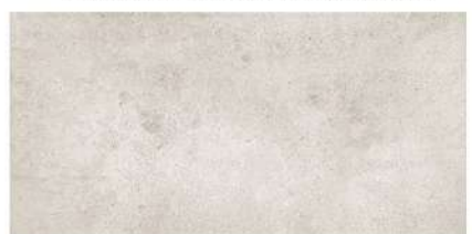
DOVER GREY PŁYTKA ŚCIENNA, 30,8x60,8 cm