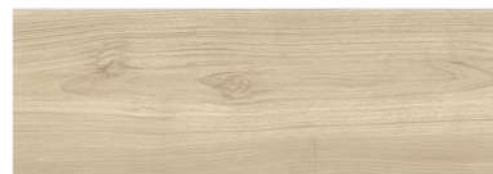
LIGHTMOOD VANILLA PŁYTKA ŚCIENNO-PODŁOGOWA, 20X60 CM