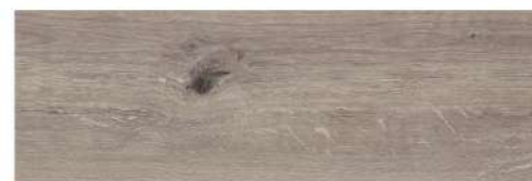
NATURALMOOD GRIGIO PŁYTKA ŚCIENNO-PODŁOGOWA, 20X60 CM