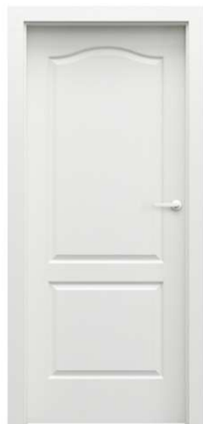
LONDYN MODEL P