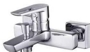
BATERIA WANNOWO - PRYSZNICOWA CERSANIT MILLE