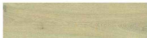
DĄB LUNA PIASKOWY PANEL PODŁOGOWY LAMINOWANY