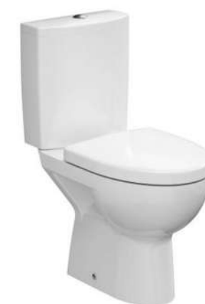
MISKA WC KOMPAKT CERSANIT PARVA