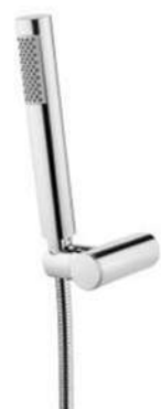
ZESTAW NATRYSKOWY DEANTE ROUND