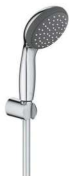
ZESTAW NATRYSKOWY GROHE START