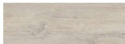
NATURALMOOD GREY PŁYTKA ŚCIENNO-PODŁOGOWA, 20X60 CM