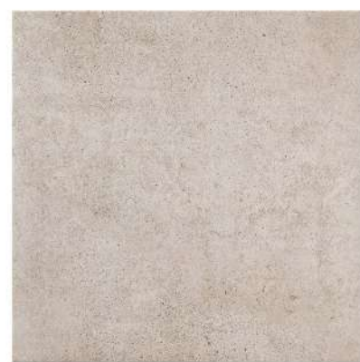
DOVER GRAPHITE PŁYTKA PODŁOGOWA (GRES SZKLIWIONY), 44,8x44,8 cm