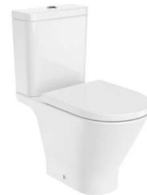
MISKA WC KOMPAKT ROCA GAP ROUND