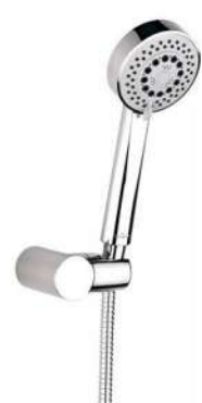
ZESTAW NATRYSKOWY CERSANIT LANO