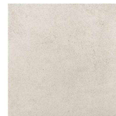
DOVER GREY PŁYTKA PODŁOGOWA (GRES SZKLIWIONY), 44,8x44,8 cm