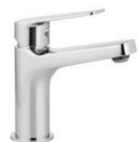
BATERIA UMYWALKOWA DANTE JASMIN