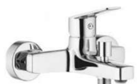
BATERIA WANNOWO - PRYSZNICOWA DEANTE JASMIN