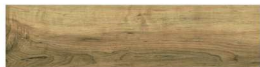
ORZECH PERGANTI PANEL PODŁOGOWY LAMINOWANY