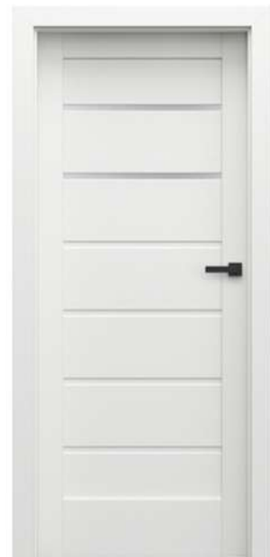
VERTE HOME GRUPA J