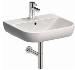
TRAFF 55x48cm, owalna