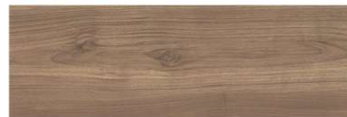
LIGHTMOOD HONEY PŁYTKA ŚCIENNO-PODŁOGOWA, 20X60 CM