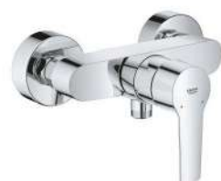
BATERIA PRYSZNICOWA GROHE START