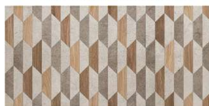
DOVER GRAPHITE GEO PŁYTKA ŚCIENNA, 30,8x60,8 cm