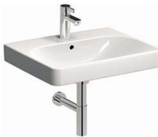
TRAFFIC 60x48 cm, prostokątna