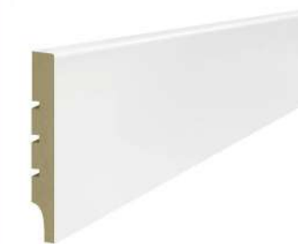
LISTWY PRZYPODŁOGOWE WYMIARY 10 X 60 MM