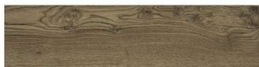
DĄB LIMERICK PANEL PODŁOGOWY LAMINOWANY