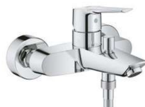
BATERIA WANNOWO - PRYSZNICOWA GROHE START