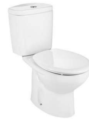
MISKA WC KOMPAKTOWA ROCA VICTORIA