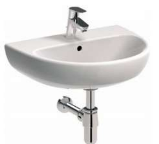
NOVA PRO 55x44cm, owalna