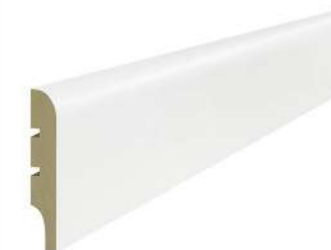
LISTWY PRZYPODŁOGOWE WYMIARY 10 X 60 MM