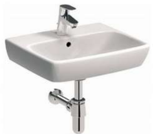
NOVA PRO 50x42cm, prostokątna