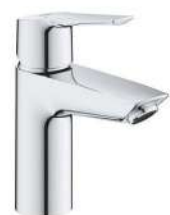
BATERIA UMYWALKOWA GROHE START