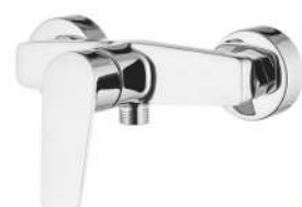
BATERIA PRYSZNICOWA DEANTE JAŚMIN