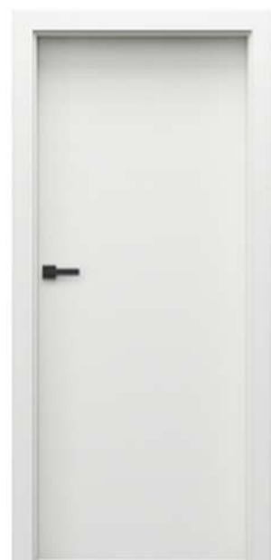
MINIMAX MODEL P