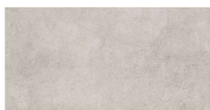
DOVER GRAPHITE PŁYTKA ŚCIENNA, 30,8x60 cm