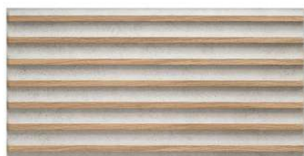
DOVER GRAPHITE STR PŁYTKA ŚCIENNA, 30,8x60,8 cm