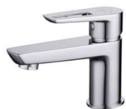
BATERIA UMYWALKOWA CERSANIT MILLE