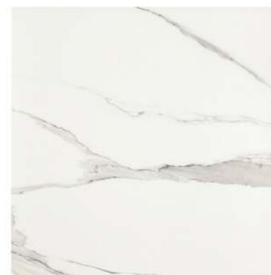
BONELLA WHITE PŁYTKA PODŁOGOWA MAT, 60X60 CM