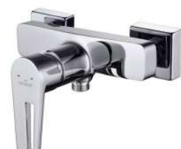
BATERIA PRYSZNICOWA CERSANIT MILLE